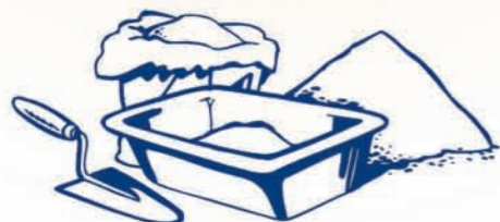
A kőműves harmadik keze!

1 Vízfolyamok feltöltése, medencék és folyóvíz retenció. Sürgős és/vagy ideiglenes munkák.